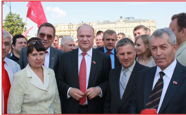
Воронежская делегация на Всероссийском съезде депутатов-коммунистов с Г.А. Зюгановым

Фракция КПРФ поддержала областную общественную патриотическую организацию «Дети военного времени» , неоднократно озвучивала перед властями всех уровней требования о дополнительной социальной поддержке данной категории ветеранов. Подготовлен проект областного