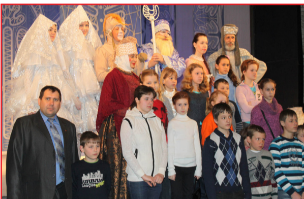
Депутаты-коммунисты Грибановского райсовета организовали поездку в Воронеж на спектакль в ТЮЗ для детей из малообеспеченных семей

3. Способствовали увеличению бюджетных расходов на народное образование, здравоохранение, культуру, спорт.