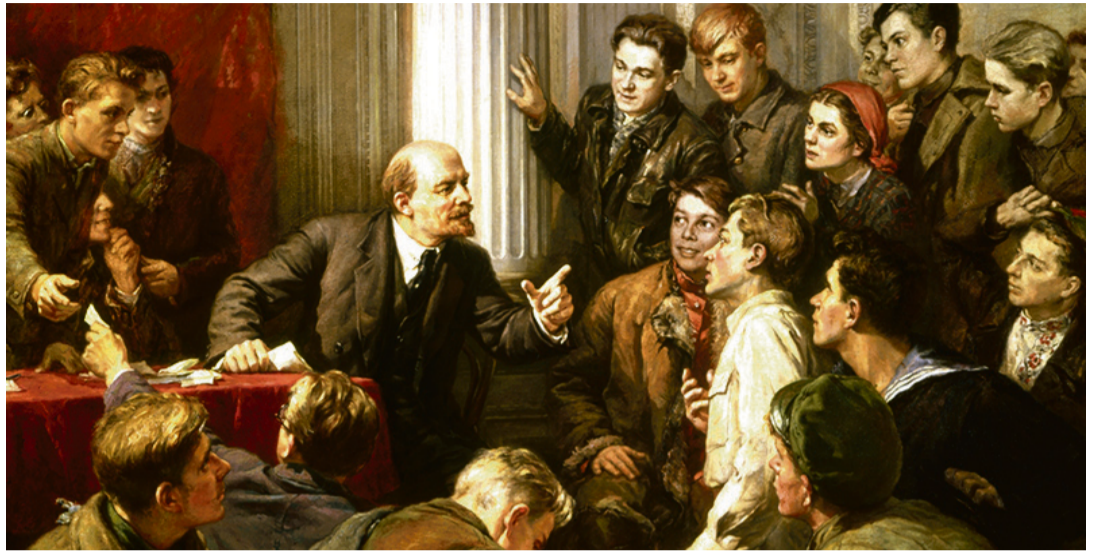
В.И. Ленин среди делегатов III съезда РКСМ. С картины художника Г. Белоусова

(Из сборника «Листья славные страницы истории Воронежского комсомола»)