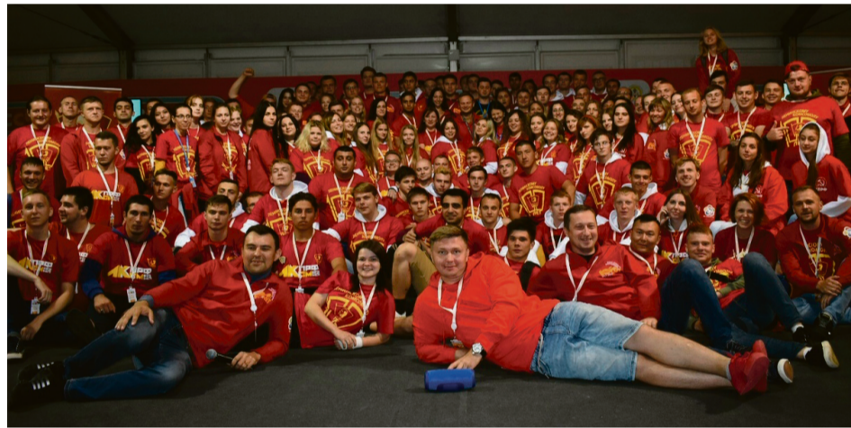
На снимке: участники Всероссийского слёта актива ЛКСМ РФ

Несколько лет назад некоторые представители власти предлагали отменить и без того копеечные стипендии студентам ВУЗов и среднетехнических учебных заведений. Но столкнувшись с мощным протестом молодежи, «ликвидаторы» отступили. Дал результаты и наш протест против пресловутой оптимизации вузов.