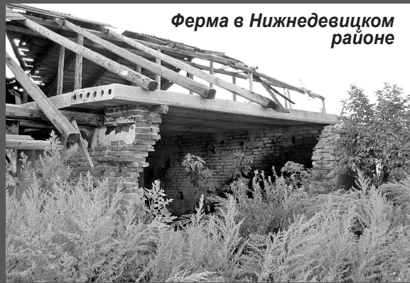
Ферма в Нижнедевицком районе