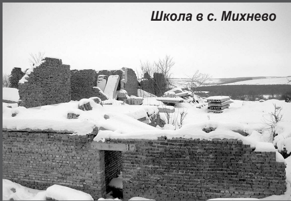
Школа в с. Михнево

Население района, составлявшее в 1989 году около 30 тысяч человек, сегодня едва дотягивает до 22 тысяч. Смертность в районе на протяжении последних лет превышает рождаемость в 4 раза (!). Вымирание населения составляет порядка 500 человек в год.