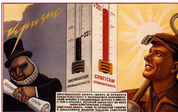
ТЕ ЖЕ ГОДЫ, ДА РАЗНЫЕ „ПОГОДЫ“

За последние 100 лет и Россия и Германия в ходе двух мировых войн понесли огромные потери, причем в обоих случаях наши потери оказались более тяжкими. Было еще одно нелёгкое испытание - Россия в 1917 году, а Германия в 1918 году пережили революционную смену власти. Но в нашей стране революция в октябре 1917 года привела к власти