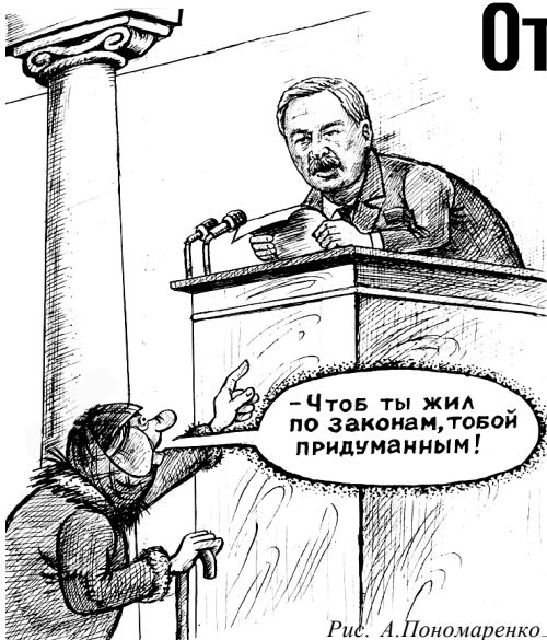
Рис. А. Пономаренко.