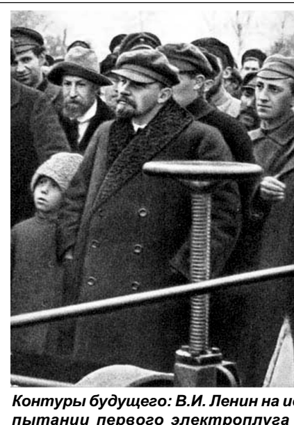
Контур будущего: В.И. Ленин на испытании первого электроплуга в опытном коллективном хозяйстве