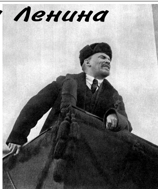
Речь в честь первой годовщины революции