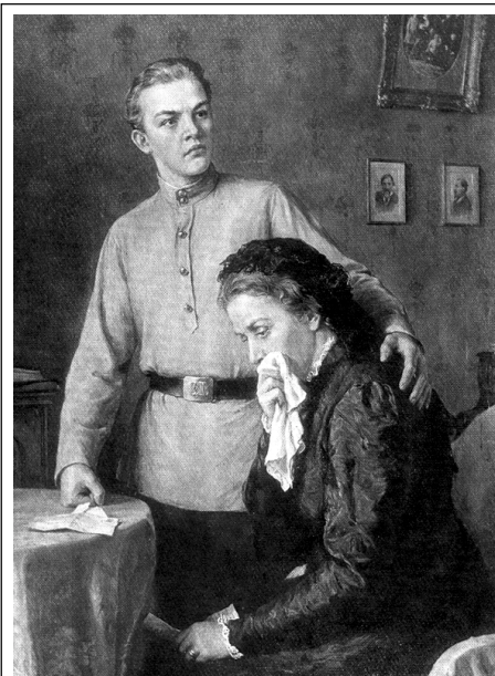
Мы пойдём другим путём

P.S. В Воронеже организуется НАРОДНЫЙ ЛЕНИНСКИЙ КЛУБ. Все, кто с уважением относится к великой советской истории, кому интересна жизнь, революционная, государственная и общественная деятельность вождя мирового пролетариата, кто знаком с литературными произведениями о Ленине, кто увлекается коллекционированием экспонатов ленинской тематики, и всех небезразличных к будущему нашей страны, звоните по телефону оргкомитета: 75-73-44.