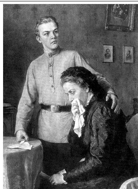
Мы пойдём другим путём

P.S. В Воронеже организуется НАРОДНЫЙ ЛЕНИНСКИЙ КЛУБ. Все, кто с уважением относится к великой советской истории, кому интересна жизнь, революционная, государственная и общественная деятельность вождя мирового пролетариата, кто знаком с литературными произведениями о Ленине, кто увлекается коллекционированием экспонатов ленинской тематики, и всех небезразличных к будущему нашей страны, звоните по телефону оргкомитета: 75-73-44.