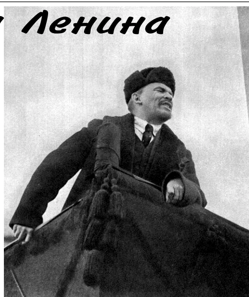
Речь в честь первой годовщины революции