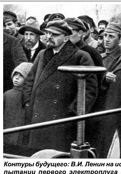
Контур будущего: В.И. Ленин на испытании первого электроплуга в опытном коллективном хозяйстве