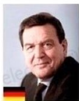
Герхард Шредер Председатель Совета директоров ПАО «НК «Роснефть», независимый директор