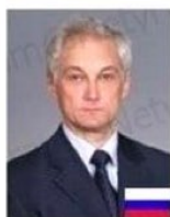
Андрей Белоусов Член Совета директоров ПАО «НК «Роснефть»