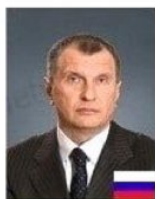
Игорь Сечин Главный исполнительный директор, Председатель Правления, Заместитель Председателя Совета директоров ПАО «НК «Роснефть»