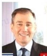
Айван Глазенберг Член Совета директоров ПАО «НК «Роснефть»